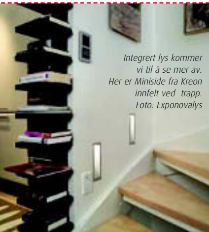
Integrert lys kommer vi til å se mer av. Her er Miniside fra Kreon innfelt ved trapp.