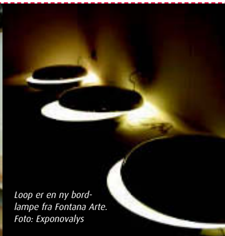
Loop er en ny bordlampe fra Fontana Arte.