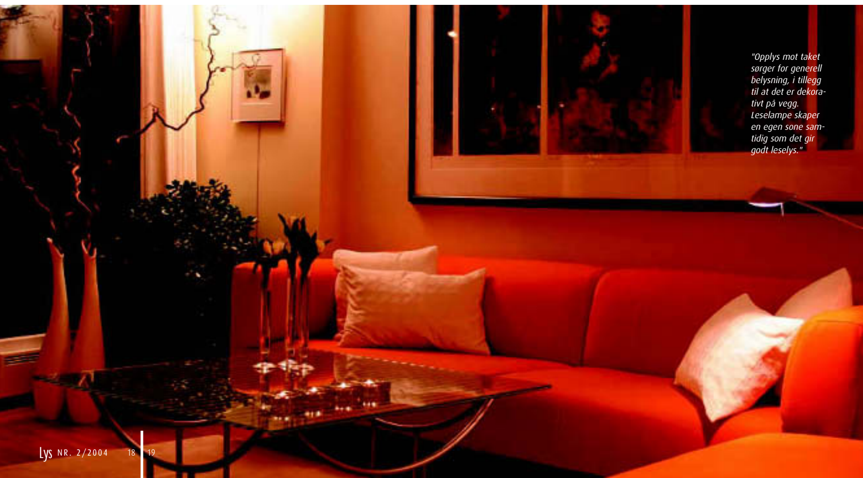
"Opplys mot taket sørger for generell belysning, i tillegg til at det er dekorativt på vegg. Leselampe skaper en egen sone samtidig som det gir godt leselys."