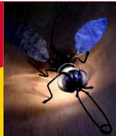
Lys med kreativ humor. Øynene og "snuten" på Mademoiselle Filou er en tesil.