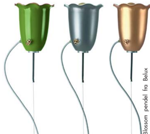
Blossom pendel fra Belux

Les mer på www.focuslysdesign.no eller ta kontakt på tlf: 23 23 31 60